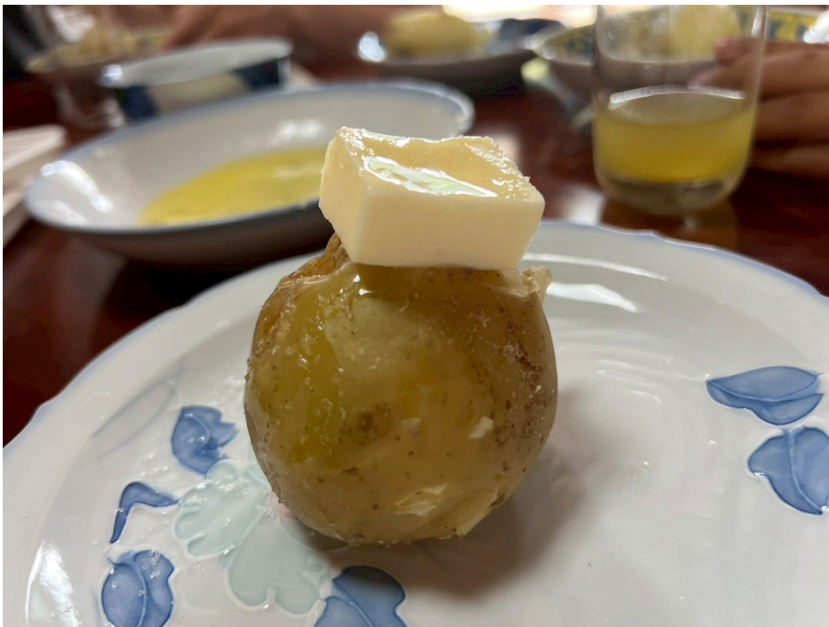
掘り立てじゃがバター