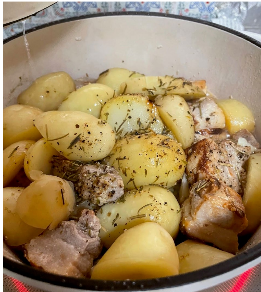
麴漬豚バラブロックと新ジャガ芋の蒸焼