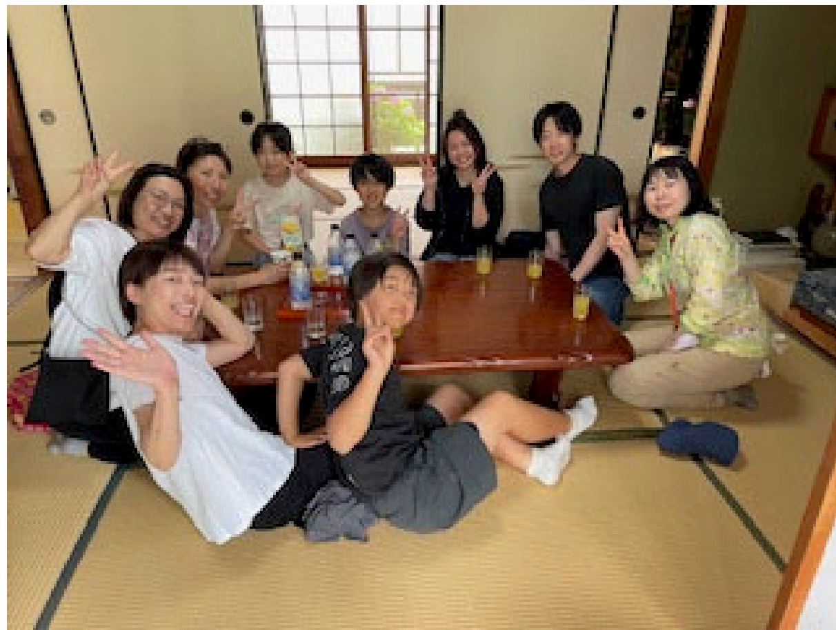
お疲れさまでした～